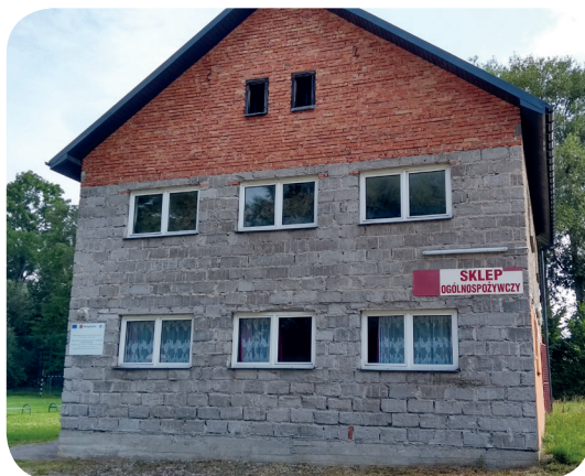
Dom Rolnika przed modernizacją

Termin realizacji był wyznaczony do 24.11.2017 r., ale prace zakończono wcześniej, mianowicie 8.11.2017 r. Odbiór wykonanego zadania został przeprowadzony 14.11.2017 r. Wartość wykonanych robót brutto wyniosła 160 721,44 zł, z czego 60 % kosztów pokryło dofinansowanie z Europejskiego Funduszu Rozwoju Regionalnego. Budynek jest częścią większego terenu rekreacyjnego w Zdzięstawicach, obejmującego również boisko, plac zabaw i plenerową siłownię.