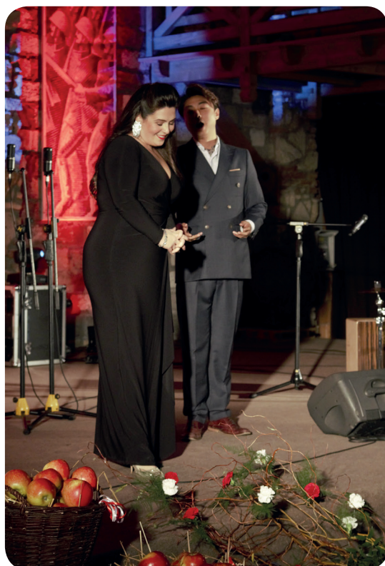
Laureaci międzynarodowego konkursu