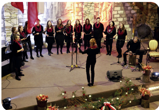
Chór Camino z Więclawic