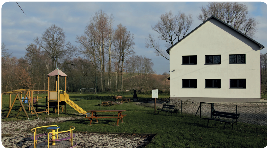
Dom Rolnika po modernizacji

Redakcja (tekst na podstawie informacji nadesłanych przez Inspektora ds.inwestycji Marzenę Cieślak)