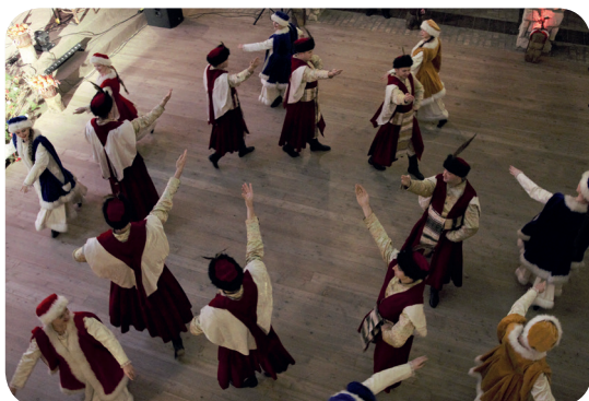
Zespół Pieśni i Tańca AGH „Krakus”