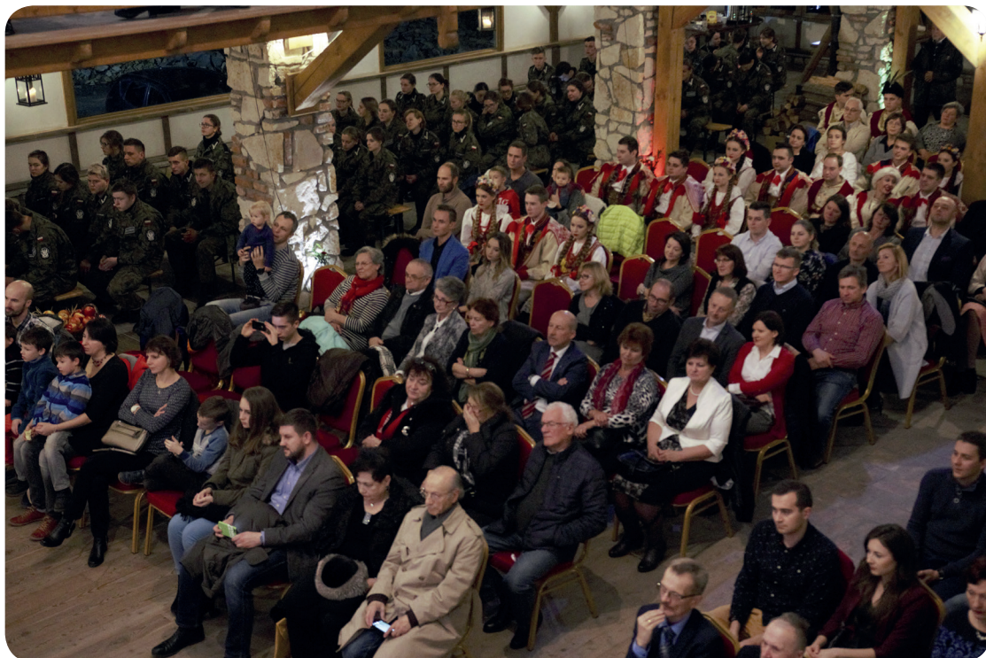
Publiczność zgromadzona podczas Koncertu Przyjaźni