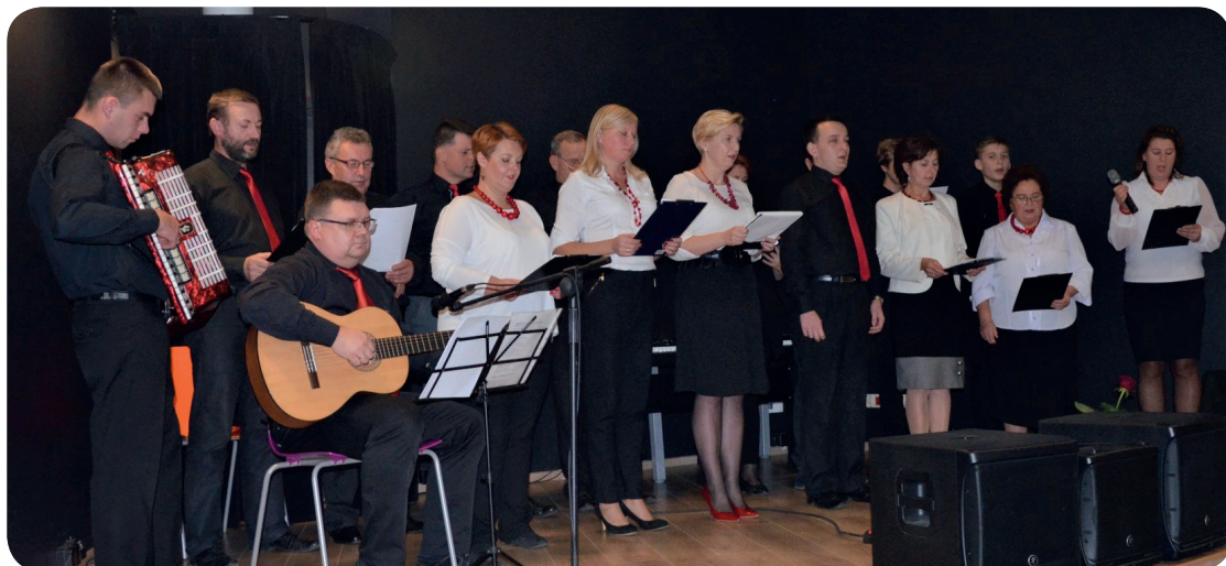
„Sami Swoi” z Górnej Wsi