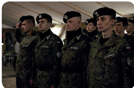
Związek Strzelecki „Strzelec”