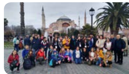
Na zdjęciu cała nasza erasmusowa grupa na tle świątyni Hagia Sophia w Stambule.

Zamieszkaliśmy u tureckich rodzin w malowniczym mieście Koaceli, położonym nad Morzem Marmara. Dzięki temu, że rodziny zaprosiły nas do siebie, mogliśmy zobaczyć ich prawdziwe życie. W Koaceli mieliśmy możliwość poznania goszczącej nas szkoły podstawowej Turkan Dereli Ilkokulu, która zrobiła na nas ogromne wrażenie. Liczy ona prawie 1000 uczniów i jest bardzo nowoczesna. Tureckie dzieci są bardzo gościnne – w szkole uczniowie młodszych klas nie odstępowały nas na przerwach na krok! Na terenie szkoły uczestniczyliśmy w wielu ciekawych warsztatach zorganizowanych przez naszych gospodarzy, np. wykonywaliśmy nadruki na papierze przy pomocy tradycyjnej tureckiej techniki, rzeźbili-