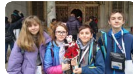
Na zdjęciu my z maskotką Polą, przed wejściem do pałacu Topkapi w Stambule.