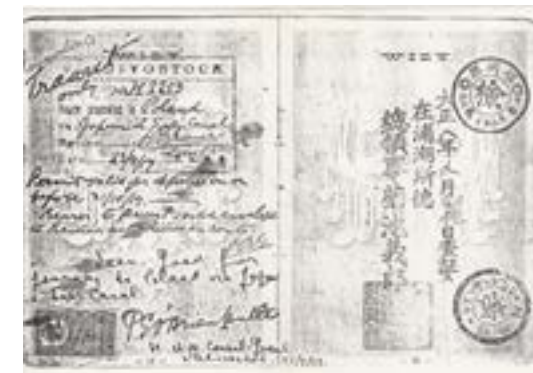
Strony z paszportu

kartki pocztowe, trafił do rosyjskiej niewoli w Barnaul (Kraj Ałtajski) najpóźniej w 1915 roku i spędził tam 4 lata. Ze skanu paszportu i wbitych tam wiz dowiedzieliśmy się, że w roku 1919 wrócił do rodziny w Polsce, podróżując przez Władywostok, Japonię, Turcję i Rumunię. Po powrocie do ojczyzny był zarządcą majątku w Łuczycach, skąd prawdopodobnie około roku 1922 trafił do Książniczek, gdzie pracował